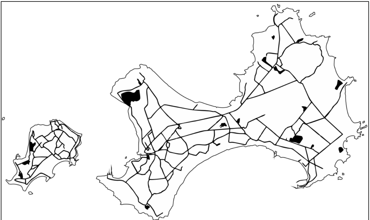
105 學年度城中暑期軍旅圖

3. 請在下圖中標示出參訪據點、出發點(例如你家)以及劃出你在這兩點之間的行進路線，並將這張地圖的比例尺與指北針補齊，建議善用彩虹鉛筆描繪，且可美化這張地圖。